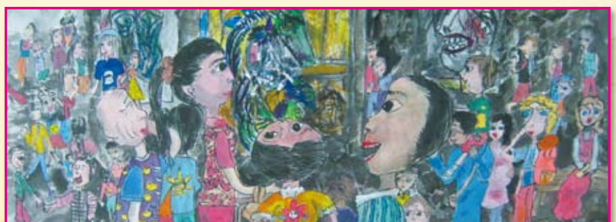
● 六年義班／李宜家 看畢卡索展