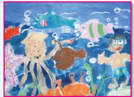
● 二年忠班／洪 恩 海底世界