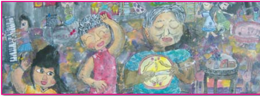
● 五年愛班／王 琺 琴瑟和鳴