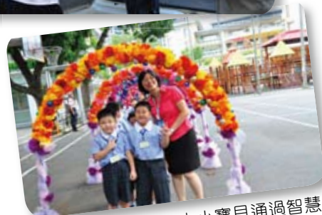
● 導師親自帶領及人小寶貝通過智慧門，進行始業學習。