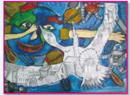
● 六年仁班／呂政潔 城市飛行