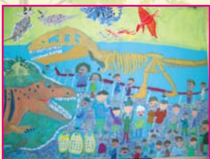
● 三年和班／廖哲立 參觀恐龍展