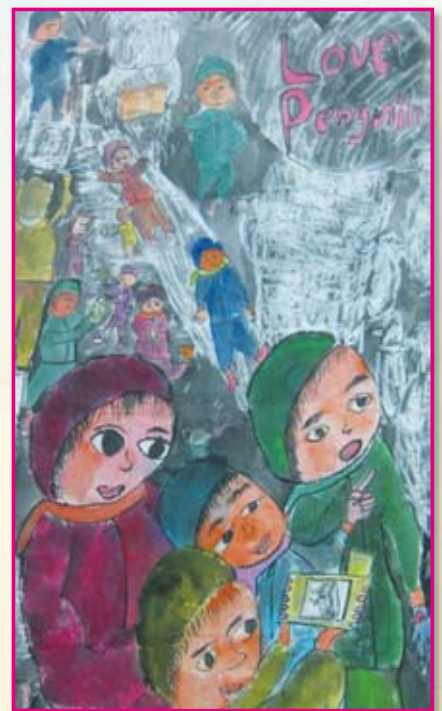
● 五年孝班／黃琬媛 看冰