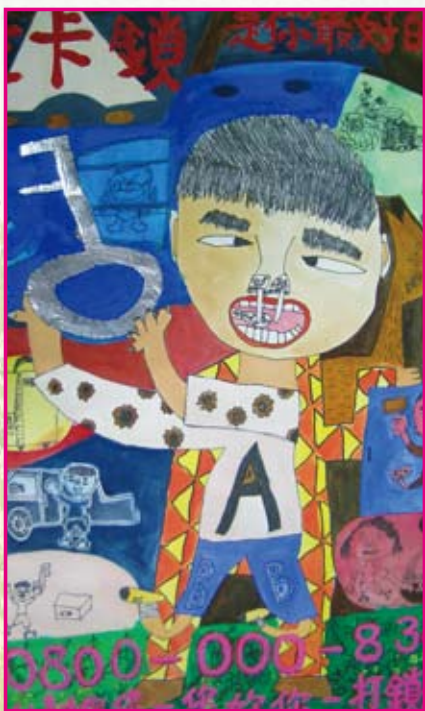
● 四年孝班／林柏翰 避卡鎖