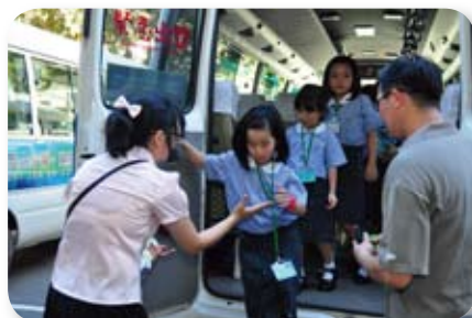
● 井然有序的交通車乘車與逃生訓練，及人小寶貝歡欣自在。