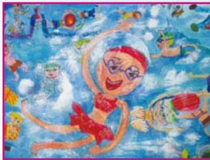
● 五年愛班／李信彤 我愛游泳