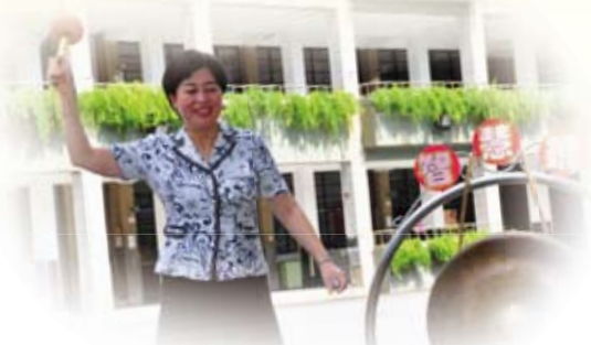
● 校長敲響智慧鑼，開啟及人小寶貝學習新頁。

歡迎及人小寶貝在美麗的花環錦簇中開鑼，期待及人小寶貝有禮貌、守規矩、勤讀書、常運動、愛整潔，成為及人小天使，在及人美麗溫馨的校園中快樂學習。