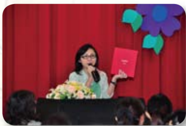
● 四學年老師輪流上台發表特殊學生輔導策略，豐富又深入，令人激賞。