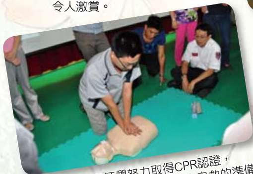
● 老師們努力取得CPR認證，做好救人自救的準備。