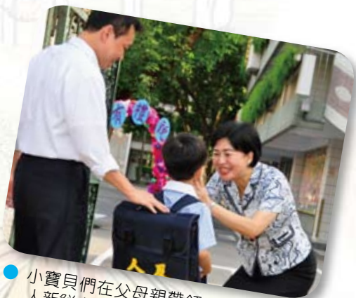
● 小寶貝們在父母親帶領下，成為及人新鮮人。