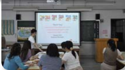
● 英語文的NEX STOP教材探討，深化學生學習。