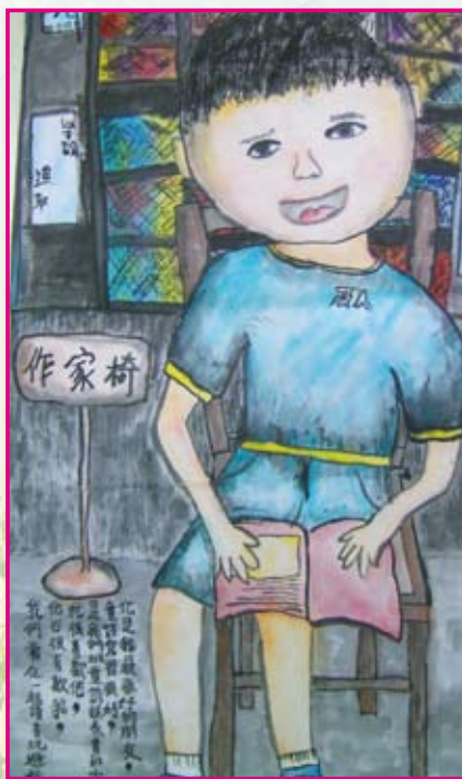
● 四年孝班／邱柏辰 我的好朋友