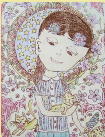
封面作品：慕夏與我 作者：四信 黃雅綺