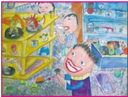
● 四年愛班／李明紘 我愛玩具店