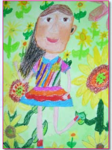
● 二和／周子蕓 在花園裡奔跑