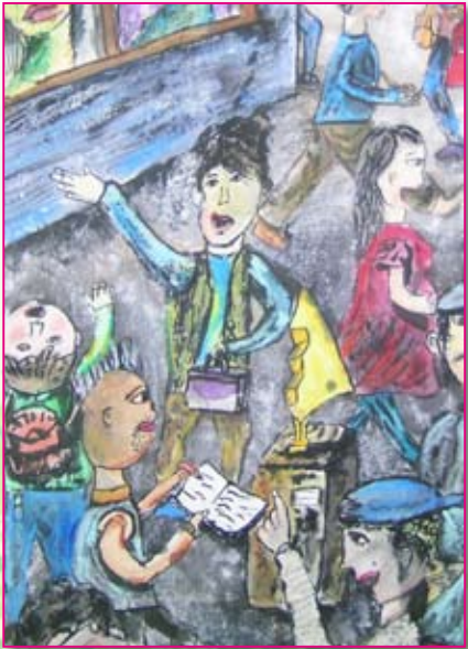
● 六仁／饒浚懷 看畫展