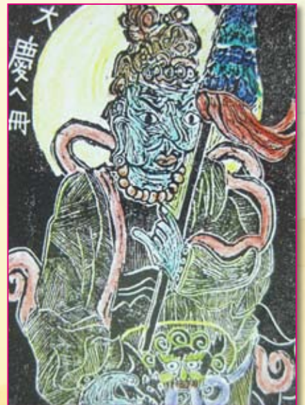
● 六仁／楊大慶 藏書票