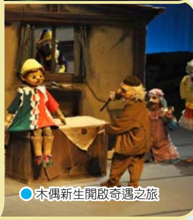
● 木偶新生開啟奇遇之旅

9月19日，本校舉辦一年一度的戲劇之旅。校長帶領全校師生一起觀賞日本飛行船劇團「木偶奇遇記」的演出，師生共享一場豐盛的藝術饗宴。