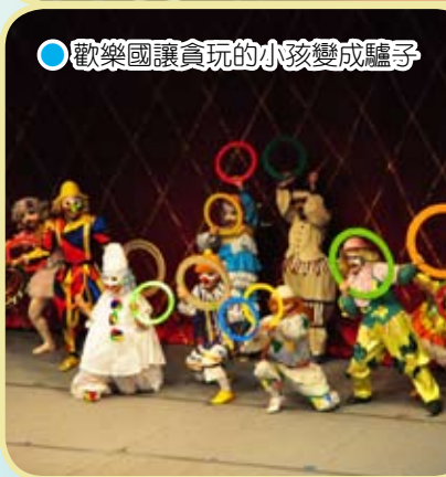
● 歡樂國讓貪玩的小孩變成驢子