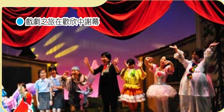
● 戲劇之旅在歡欣中謝幕