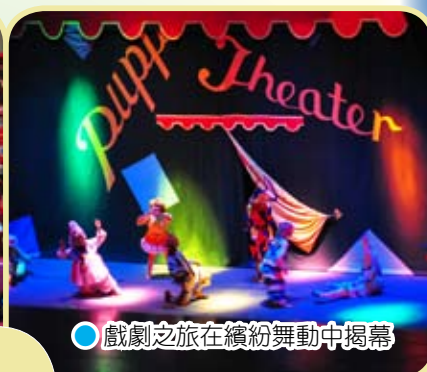
● 戲劇之旅在繽紛舞動中揭幕