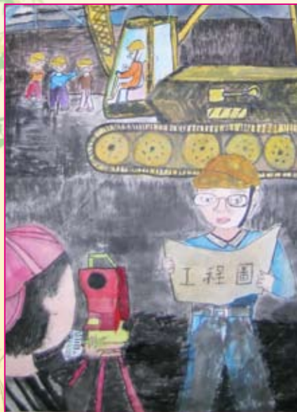
● 四仁／謝曜宇 工作中的爸爸