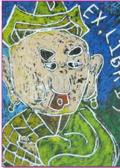
● 四孝／江庭葳 藏書票