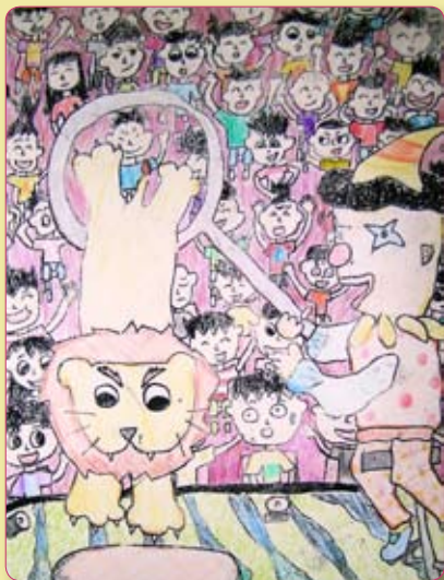
封面作品：馬戲團 作者：四仁 王佩蓁