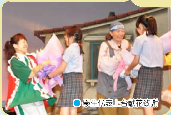
● 學生代表上台獻花致謝