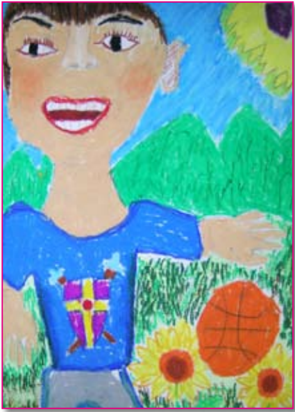
● 二義／鄭博允 我愛玩籃球