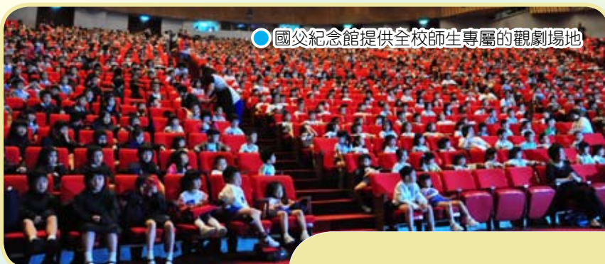
● 國父紀念館提供全校師生專屬的觀劇場地