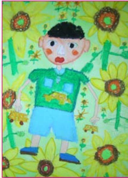
● 二和／張惟翔 向日葵花田