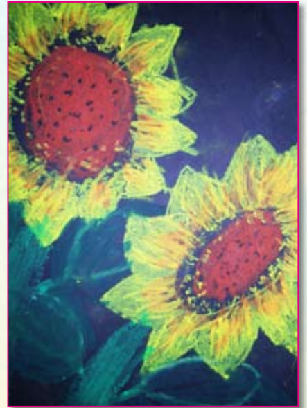
● 二忠／張晴茹 向日葵