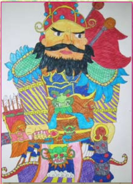
● 四孝／黃楷雯 門神