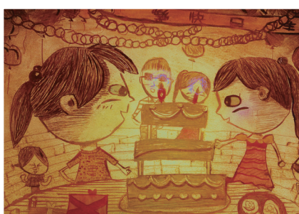
四義 / 林佑真 感動的時刻