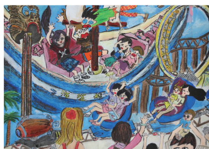
六忠 / 張睿婷 歡樂天堂