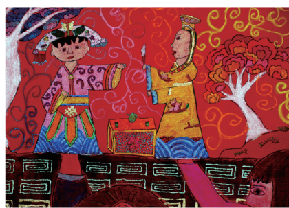
五義 / 王玥凌 台下功夫