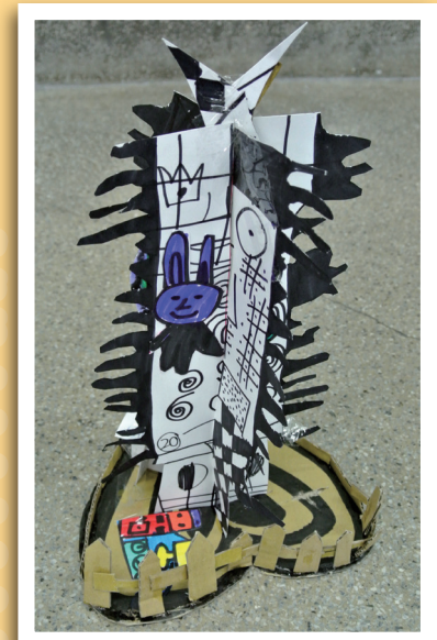
四愛 / 胡錦豐 夢想樹