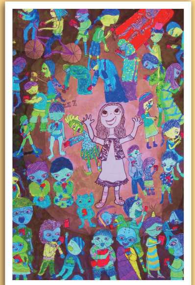
三和 / 余恩韻 低頭時,錯過了什麼