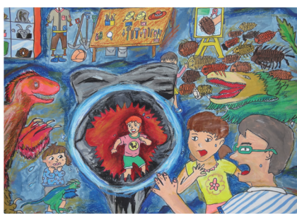
六忠 / 劉苓榛 考古奇遇