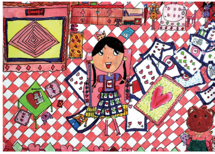
四孝 / 林羿岑 撲克牌女王