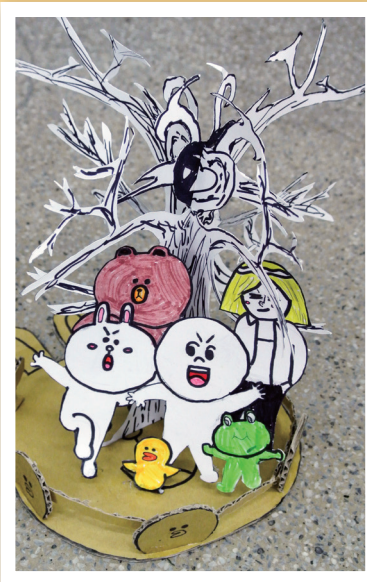
四愛 / 曾星晴 夢想樹