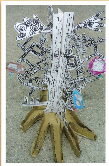
四愛 / 陳奕均 夢想樹