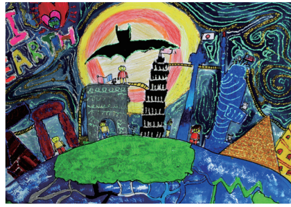
四孝 / 鄭瀚 世界慶典