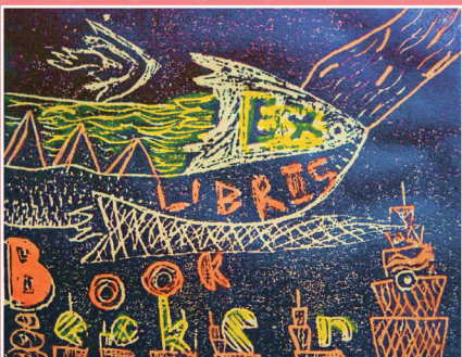
◆ 五忠 / 張熹鵬 未來的交通工具