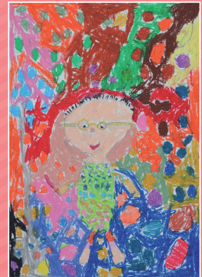
◆ 一愛 / 孫麒宸 我與點點