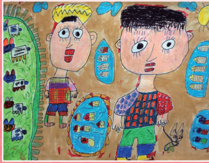
◆ 二信 / 陳泓勳 暑假記趣