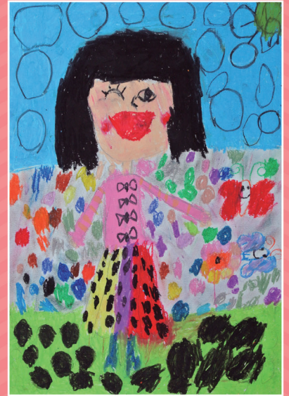
◆ 一忠 / 黃得媛 我與點點