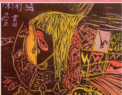
◆ 五仁 / 陳俐綺 未來的交通工具