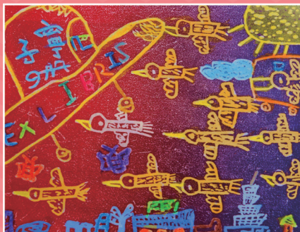
◆ 四和 / 吳子寧 未來的交通工具