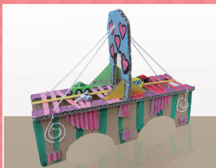
◆ 六孝 / 楊晴瑜 橋