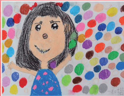
◆ 一和 / 廖楷丞 我與點點