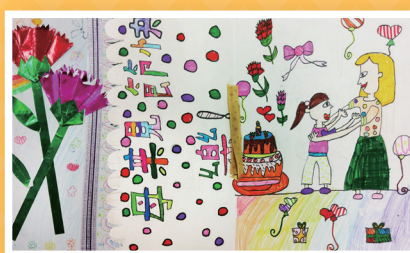
二忠 / 李宥萱 愛的抱抱 感恩卡