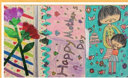
二義 / 林子婷 愛的抱抱 感恩卡