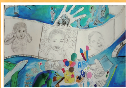
六義 / 吳建靈 我的成長地圖