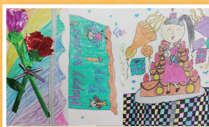
二愛 / 黃喬琳 愛的抱抱 感恩卡