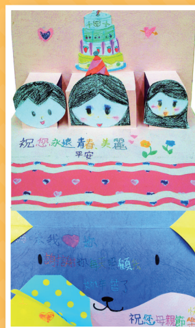
三仁 / 程婕汝 立體卡