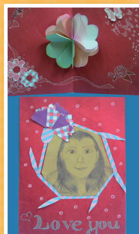
五信 / 蔡勻甄 感恩卡