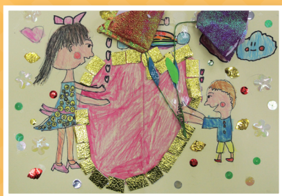
一義 / 李奕勳 感恩卡