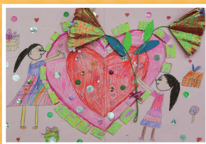
一忠 / 鄭鈺蒨 感恩卡