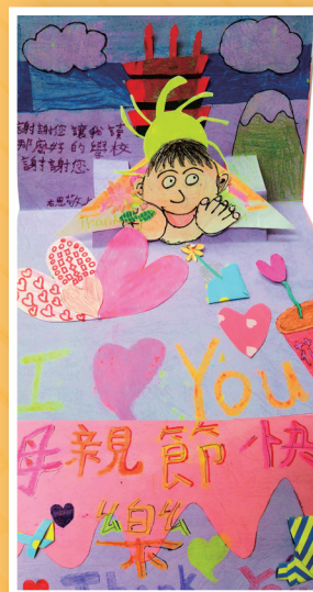
三愛 / 陳右恩 立體卡