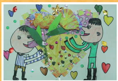
一愛 / 林泓勳 感恩卡