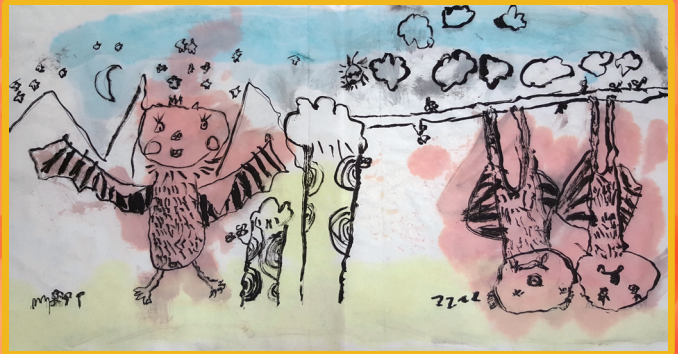
二仁 黃悅珊 可愛的蝙蝠