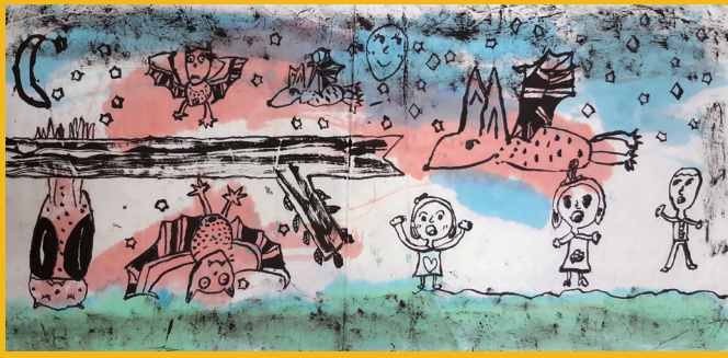
二孝 李佑熹 可愛的蝙蝠