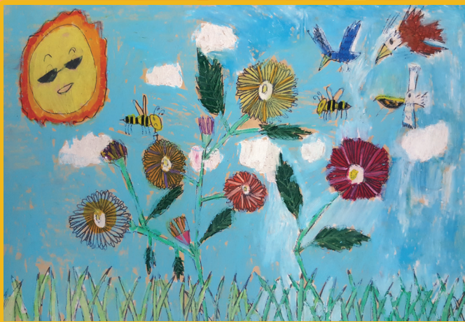
二義 胡修齊 美麗的花園