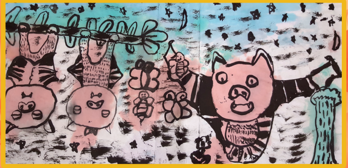
二和 黃巧瑩 可愛的蝙蝠