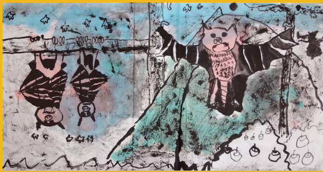
二和 林辰諺 可愛的蝙蝠