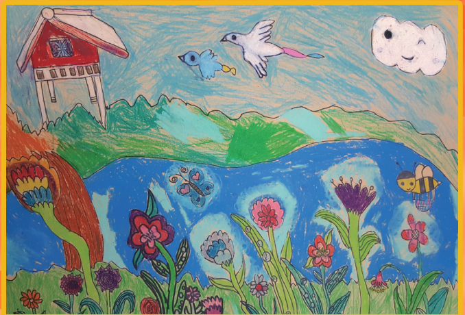
二和 張祖挺 美麗的花園