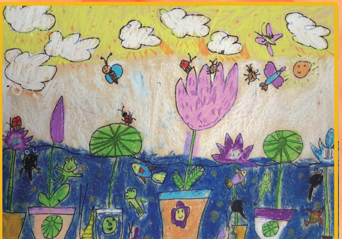
二信 呂艾穎 美麗的花園