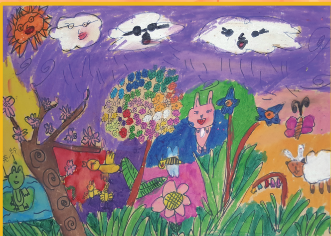
二信 黃紫瑄 美麗的花園