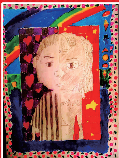
四和 張耀儀 創意自畫像