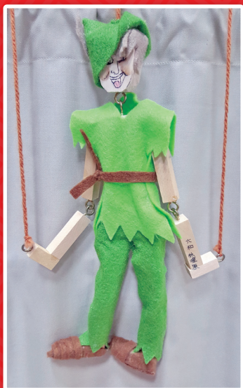
六和 林塏原 傀儡戲偶