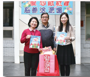
106 學年度冬令愛心捐款統計表