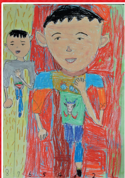
一和 唐煒智 校園遊戲