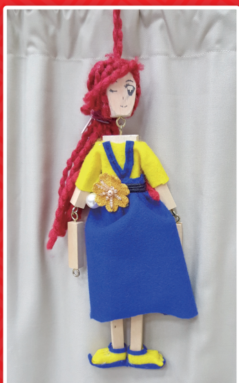
六仁 林恩 傀儡戲偶