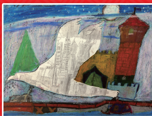
五信 李季家 城市飛行