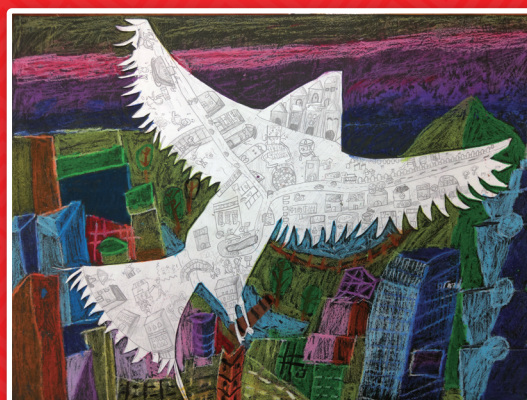
五義 邱宇萱 城市飛行