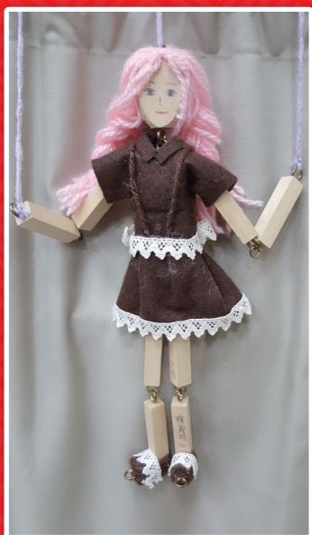
六忠 徐宥均 傀儡戲偶