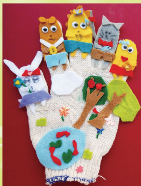
三忠 王煜璇 手套偶