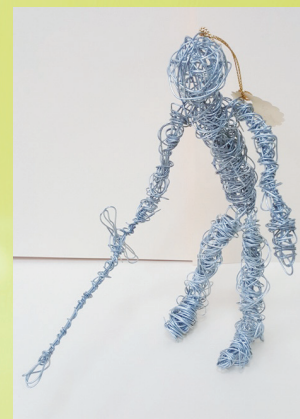
六義 蕭宇博 人物