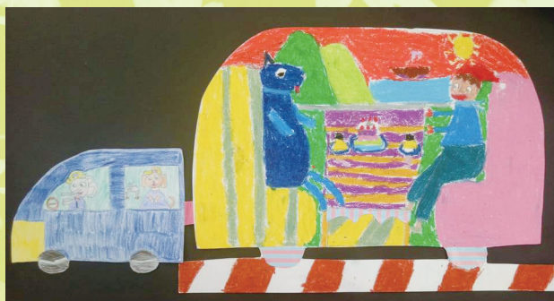
二愛 陳盈璇 我和動物旅行記