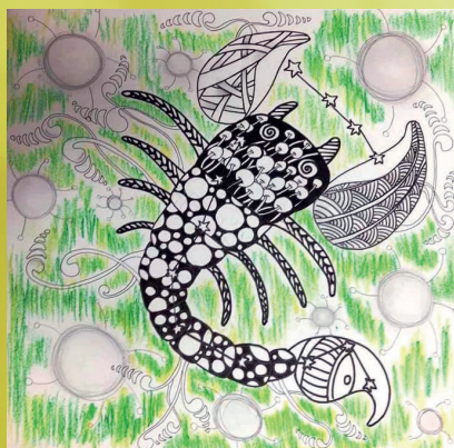
四義 吳睿哲 星座禪繞畫