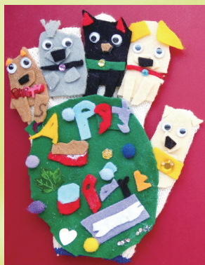
三和 曹京泳 手套偶