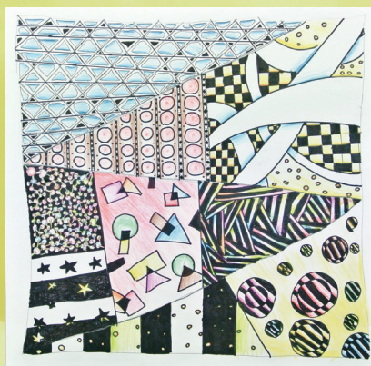
四孝 徐定睿 禪繞畫