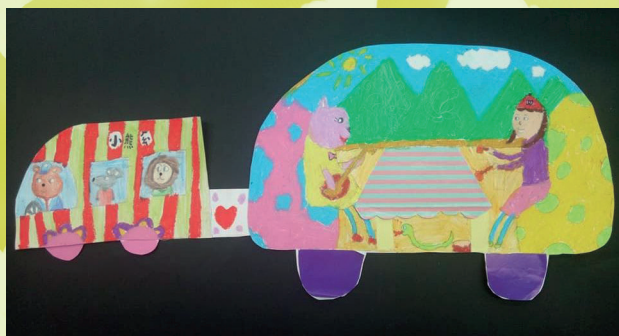
二孝 吳羽妮 我和動物旅行記