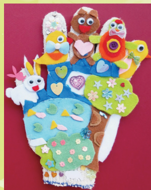
三信 董恩綺 手套偶