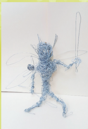
六信 陳羿達 人物