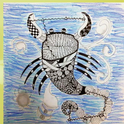
四義 李廷云 星座禪繞畫