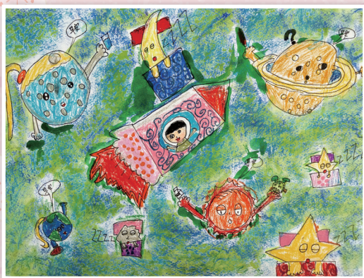
三孝 / 黃紫瑄 太空之旅