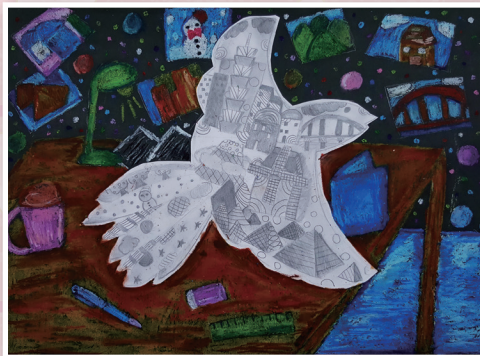
五愛 / 李柚晴 城市飛行