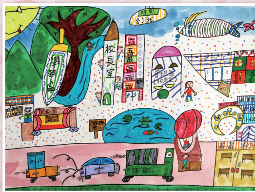
三忠 / 李侑熹 夢幻校園