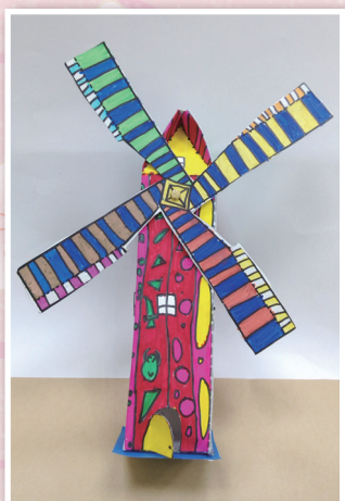
二孝 / 丁柏獻 轉轉風車