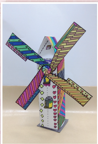
二仁 / 徐浩嘉 轉轉風車