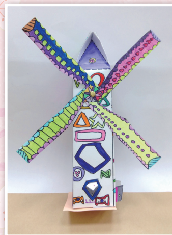
二忠 / 廖子晴 轉轉風車