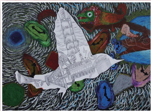
五愛 / 張皓然 城市飛行