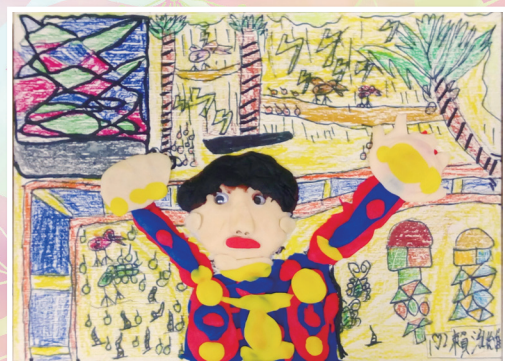
一愛 / 賴泓維 我愛及人好風光