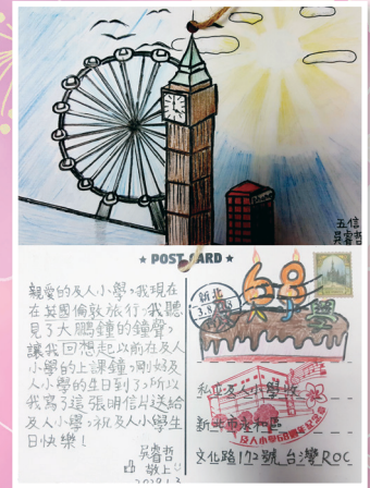
五信 / 吳睿哲 愛，沒有距離