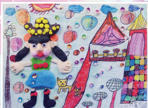
二仁 / 黃可蔓 我愛及人好風光