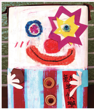
三信 / 廖武鎰 藝術繽紛疊疊樂