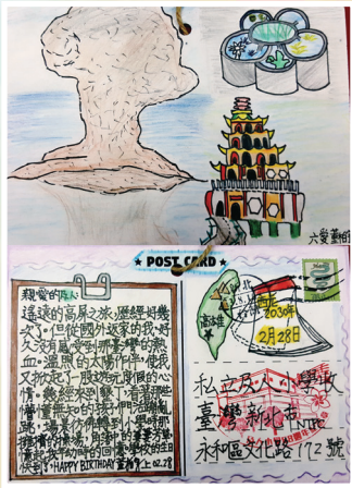
六愛 / 董柏宇 愛，沒有距離