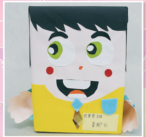
四愛 / 黃郁升 藝術繽紛疊疊樂