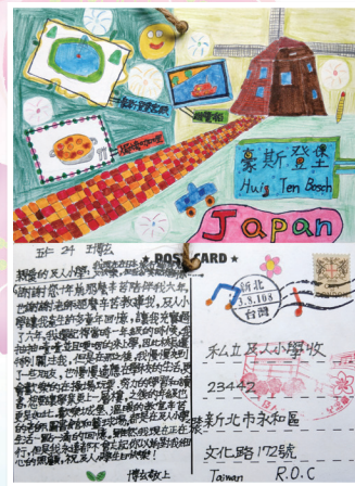
五仁 / 王博玄 愛，沒有距離