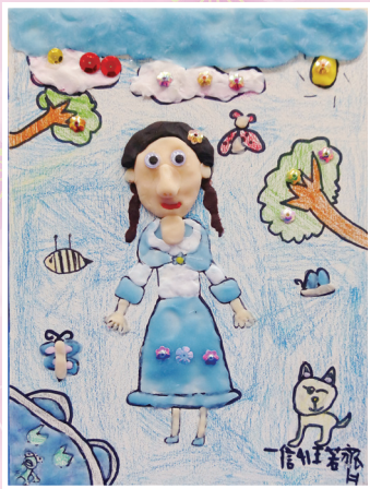
一信 / 王若齊 我愛及人好風光