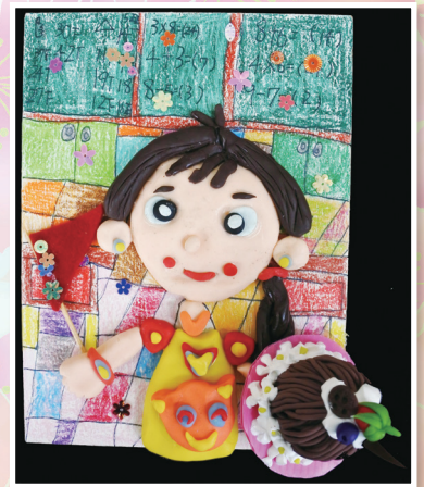
二義 / 陳可芸 及人生日快樂