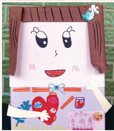
三忠 / 李侑熹 藝術繽紛疊疊樂