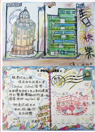
六義 / 林柏宇 愛，沒有距離