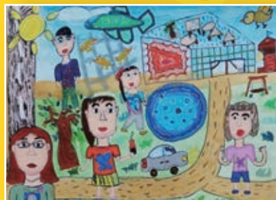
四忠 / 李侑熹 暑假記趣