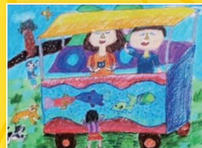
四義 / 鄭榆澄 暑假記趣