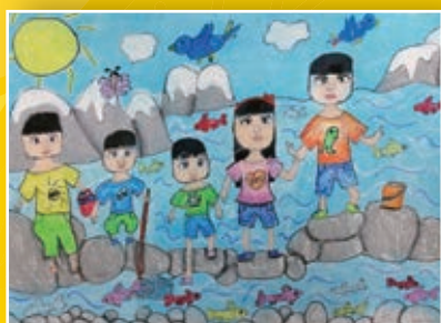
四孝 / 林希璇 暑假記趣