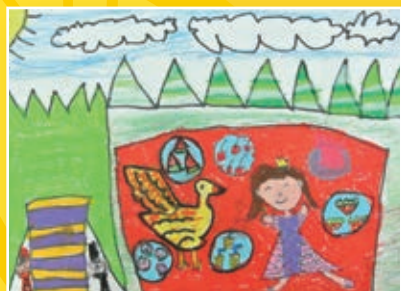
一仁 / 游祐欣 我與鴨鴨