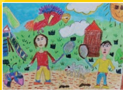
二孝 / 劉語丞 暑假記趣