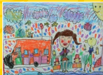
一孝 / 賴苡函 我與鴨鴨