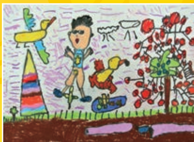
一仁 / 呂鈺宸 我與鴨鴨