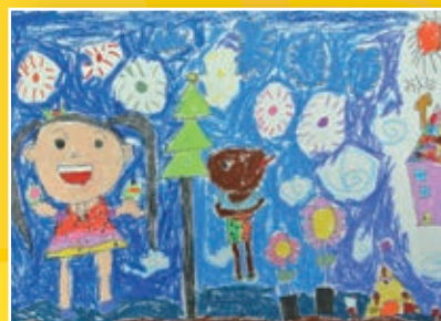
一忠 / 周羽彤 我與鴨鴨