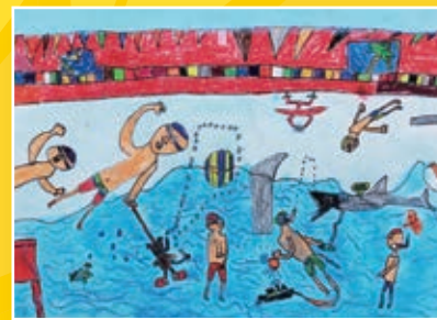
二愛 / 林玗緯 暑假記趣