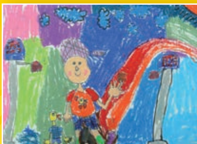
一孝 / 蘇紹捷 我與鴨鴨