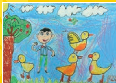
一忠 / 林昀立 我與鴨鴨