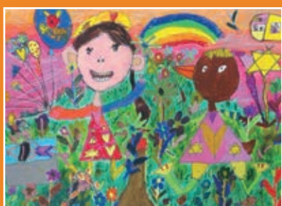
一義 / 管童 我的小花園