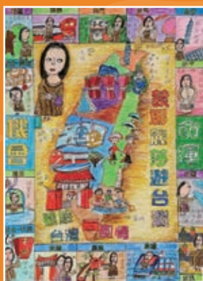
四義 / 王思云 蒙娜麗莎遊台灣