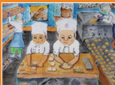
五義 / 林品碩 麵包坊