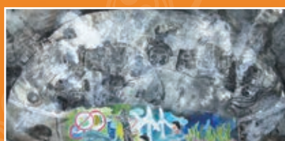
五孝 / 林士鈞 地球很有事