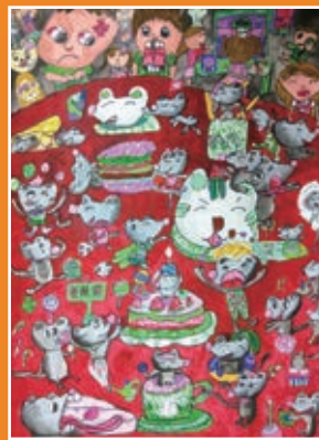
三忠 / 許瑋育 老鼠的盛宴