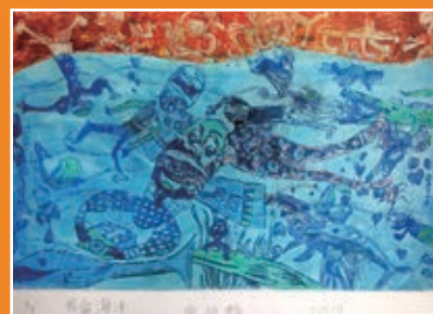
三孝 / 曾怡甄 我愛海洋