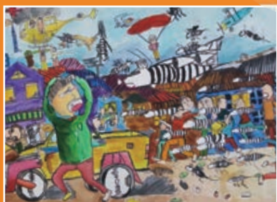
五愛 / 徐霖嘉 大黃蜂來襲