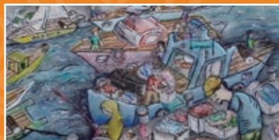
六孝 / 蔡承燁 漁港風光