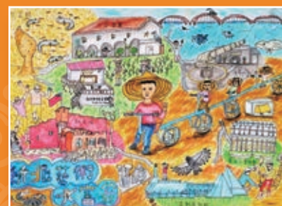
四孝 / 蕭廷安 新北藝術大富翁