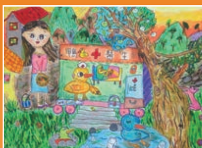
二信 / 黃晴蔚 森林裡的鴨醫生