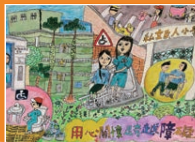
四孝 / 陳芷萱 用心關懷跨越障礙