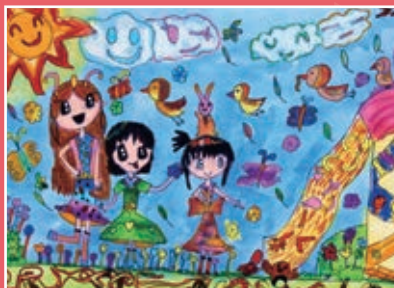
三愛 / 吳亞臻 生活記趣