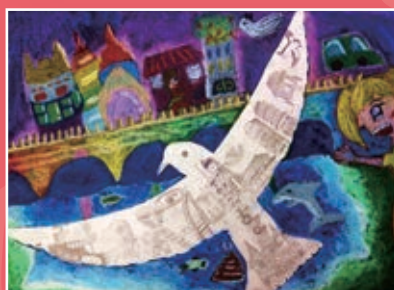
五忠 / 莊永語 城市飛行