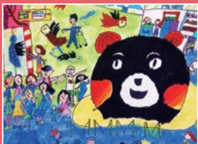
三和 / 林昱絜 生活記趣