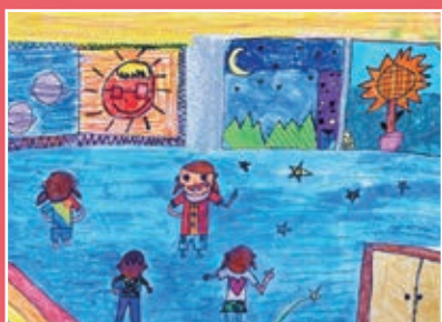
三義 / 顏詩庭 生活記趣