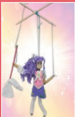
六和 / 陳綺穎 傀儡戲偶