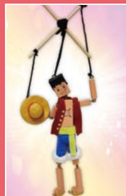
六義 / 沈昀葶 傀儡戲偶