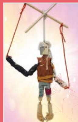
六仁 / 丁睿哲 傀儡戲偶