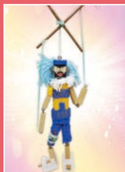
六愛 / 許哲璋 傀儡戲偶