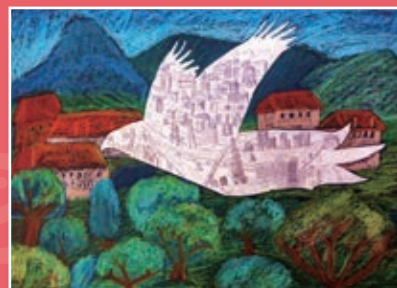
五仁 / 柴力璋 城市飛行