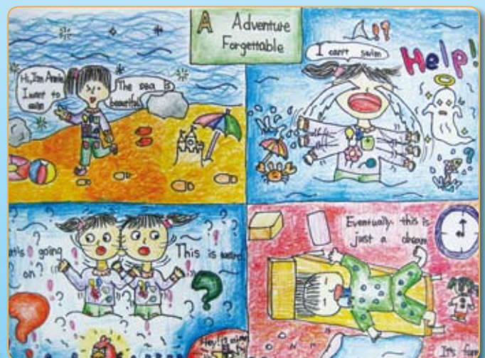
● 四仁／林奕廷 A Adventure Forgettable （中年級佳作）