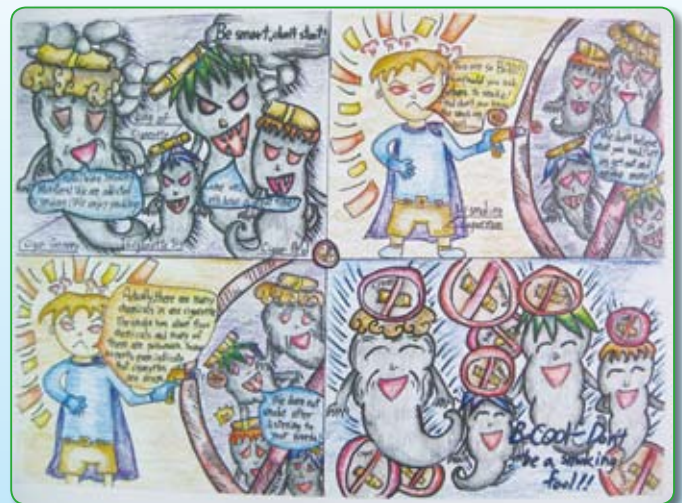
● 六孝／羅廣哲 Be smart, don't start! （高年級佳作）