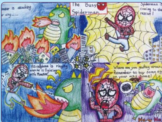
● 四仁／謬詠璿 The busy spiderman （中年級佳作）