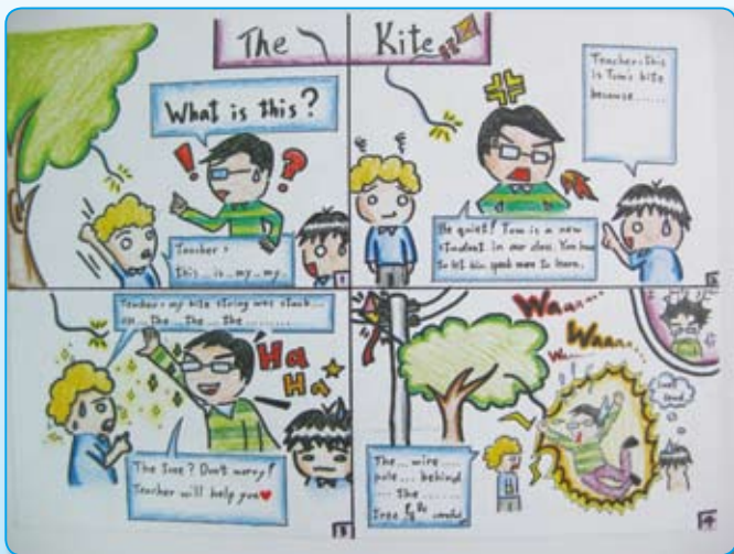
● 六仁／趙詠婕 風箏記 （高年級佳作）