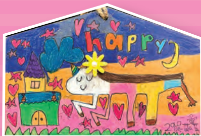
一愛 / 吳茲芸 畫我繪馬