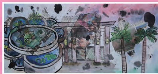
五信 / 董恩綺 彩墨校園