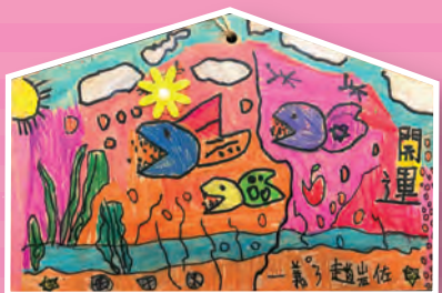
一義 / 趙岩佐 畫我繪馬