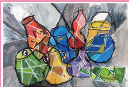
五忠 / 孫麒宸 這些瓶子 · 那些瓶子