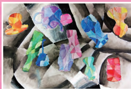
五孝 / 李唯瑄 這些瓶子 · 那些瓶子