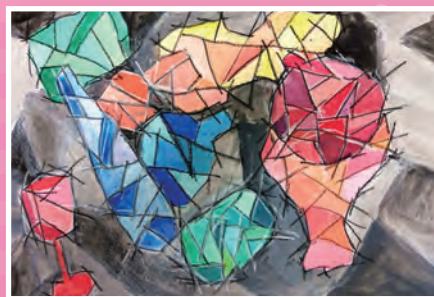
五仁 / 陳俊輔 這些瓶子 · 那些瓶子