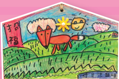
一信 / 洪銘峻 畫我繪馬