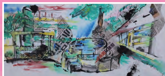
五信 / 林思語 彩墨校園