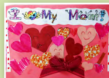
三孝 / 柳昀辰 感恩卡