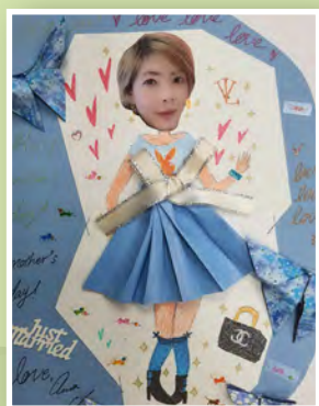
五義 / 陳昵貽 媽媽我愛您