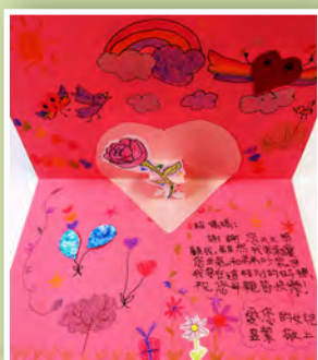
三和 / 林昱潔 感恩卡