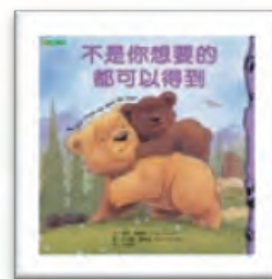
《不是你想要的都可以得到》