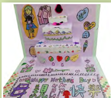
二仁 / 張芷維 母親節蛋糕卡