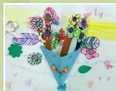
一愛 / 胡馨 滿花香母親卡