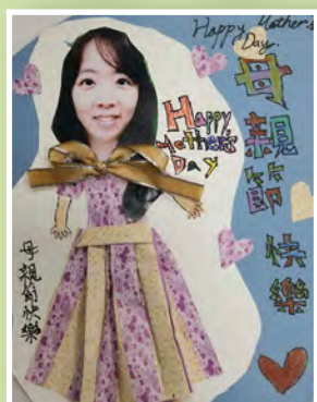
五義 / 林禾軒 媽媽我愛您