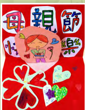
三忠 / 許瑋育 感恩卡