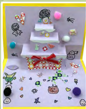
二義 / 王昱喬 母親節蛋糕卡