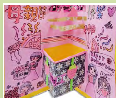
四和 / 陳憶嫻 愛的禮物