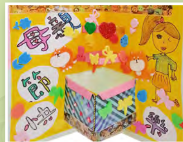
四愛 / 傅先秀 愛的禮物