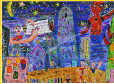
一義 / 詹亞勳 星空下的英雄