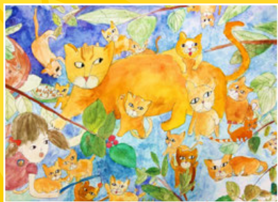
四仁 / 胡珈瑀 母愛