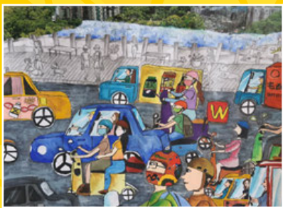
六孝 / 李禹臻 繁忙大馬路