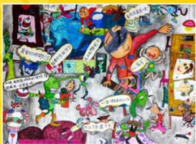
四孝 / 曾怡甄 AI一隅