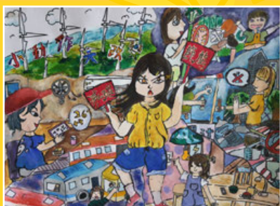
五仁 / 李念 節能減碳