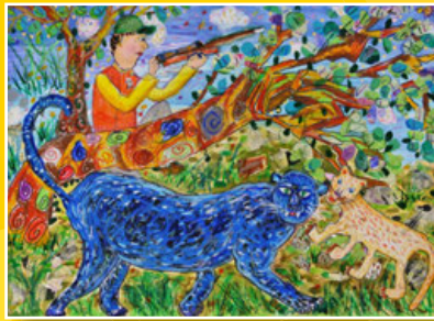
一愛 / 陳威旭 獵豹家族