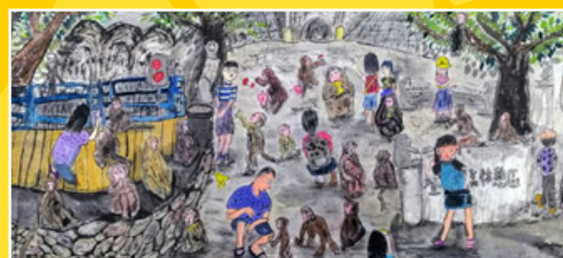
三忠 / 徐慈彤 賞猴趣