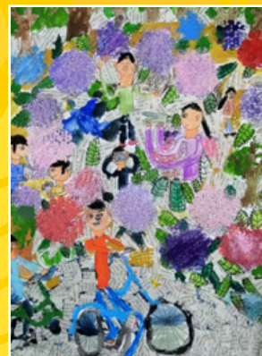
二義 / 廖軒廷 賞花趣