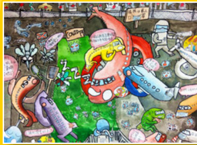
五義 / 曾勇橙 飛機好閒