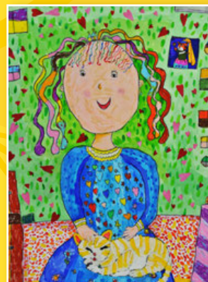
一忠 / 薛楷潔 我的小寶貝