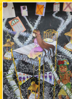
六信 / 曾沛璿 夢境