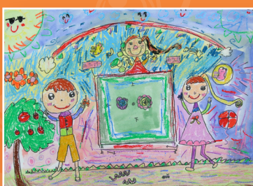
一和 / 郭育興 校園遊戲