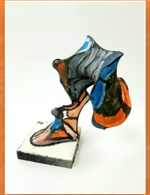
六義 / 黃思齊 鞋的世界