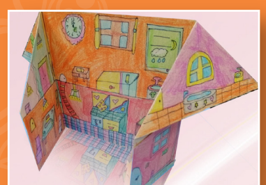
三愛 / 李佩恩 我的小屋