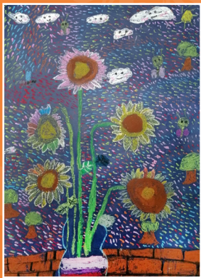
二義 / 楊佳璇 向日葵