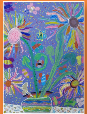
二愛 / 吳茲芸 向日葵