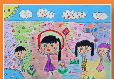
一忠 / 陳則希 校園遊戲