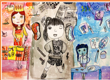
四和 / 吳亞潔 超越時空自畫像