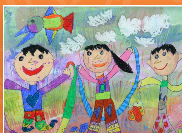
一信 / 車若瑜 校園遊戲