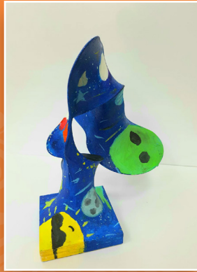
六愛 / 周郁甯 奇幻太空