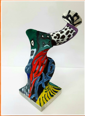
六愛 / 余建均 創意雕塑