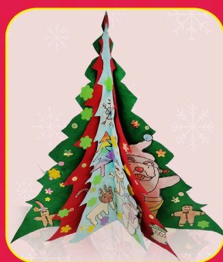
三仁 / 李彥廷 立體聖誕樹