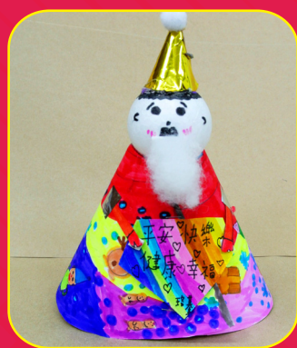
二忠 / 孫珞慕 聖誕老人