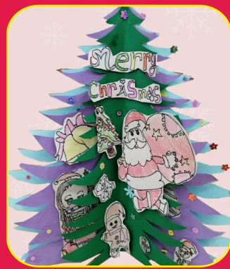
三忠 / 游丹瑜 立體聖誕樹