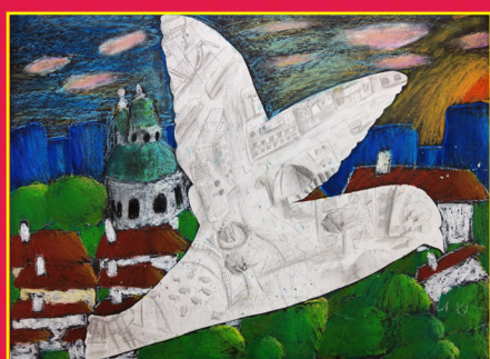
五信 / 孫晴暄 城市飛行