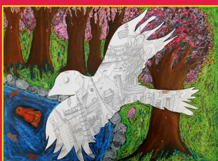
五孝 / 李可云 城市飛行