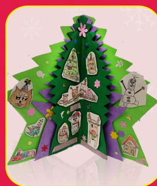
三愛 / 畢可昀 立體聖誕樹