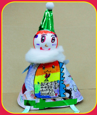
二仁 / 簡翊涵 聖誕老人