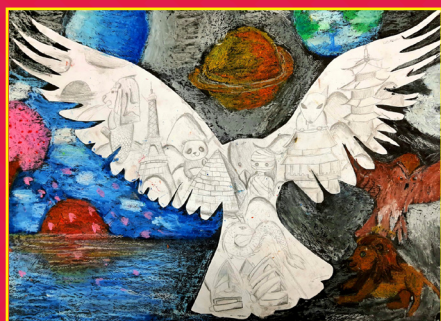
五仁 / 陳芷萱 城市飛行