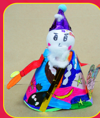
二孝 / 陳加恩 聖誕老人