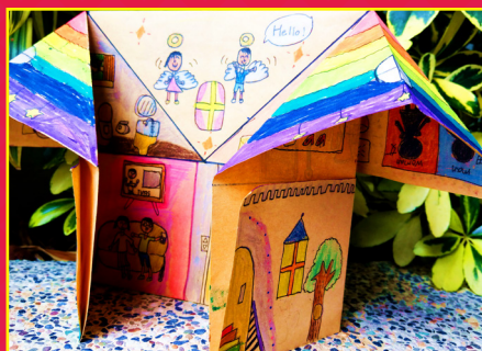
三信 / 盧又瑄 我的創意小屋