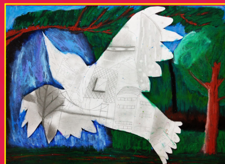
五義 / 陳宥霓 城市飛行