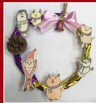
一愛 / 洪睿甯 聖誕花圈