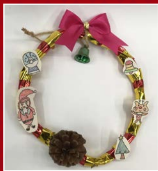
一孝 / 陳芷彤 聖誕花圈