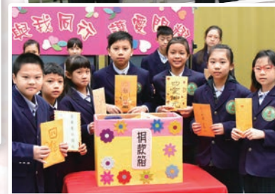
109 學年度愛心捐款統計表