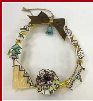
一和 / 黃品嫻 聖誕花圈