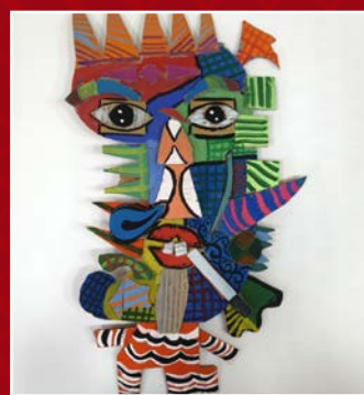
五愛 / 李逸齊 面具