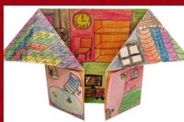
三孝 / 李沛蓁 創意小屋