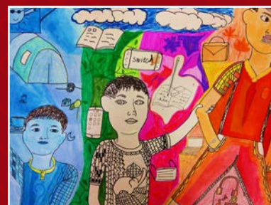
四仁 / 徐浩嘉 超越時空自畫像