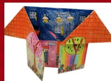
三和 / 張全旻 創意小屋