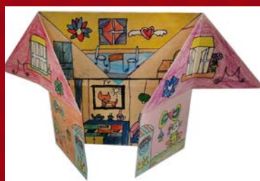
三忠 / 李牧涵 創意小屋