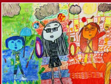
四愛 / 陳愷臻 超越時空自畫像