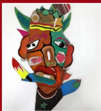
五愛 / 王婕妤 面具