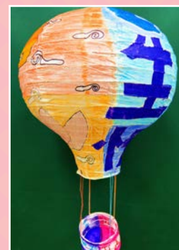
三信 / 黃浩彬 展望未來 夢想起飛