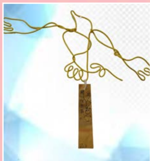
六信 / 劉孟愷 飛鳥爭鳴 愛無限