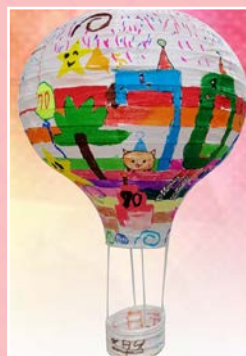
三和 / 尤喬穎 展望未來 夢想起飛