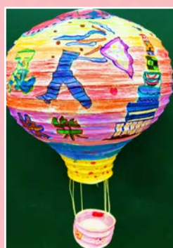
四忠 / 劉紫桐 展望未來 夢想起飛