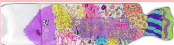
二和 / 范瀚云 魚躍及人慶70