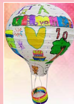
三仁 / 李侑珊 展望未來 夢想起飛