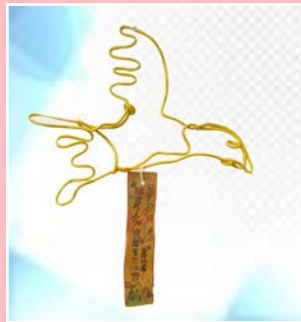
五仁 / 陳芷萱 飛鳥爭鳴 愛無限