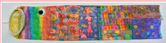
一信 / 黃允安 魚躍及人慶70