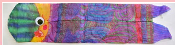
二孝 / 陳沛誼 魚躍及人慶70