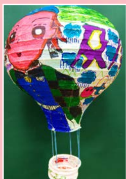
四孝 / 何宇翔 展望未來 夢想起飛