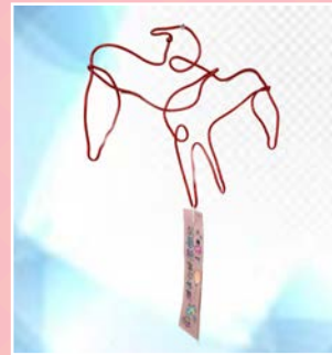
五忠 / 李睿恩 飛鳥爭鳴 愛無限