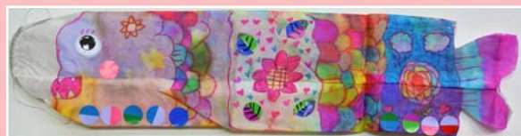
一孝 / 劉栩志 魚躍及人慶70