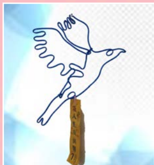
六仁 / 柴力璋 飛鳥爭鳴 愛無限