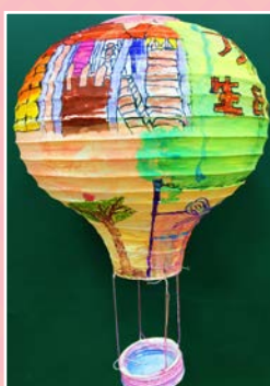
四仁 / 胡珈瑀 展望未來 夢想起飛