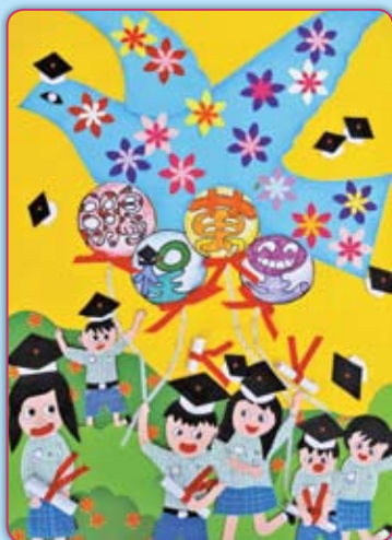
封面作品：畢業祝福海報 作者：五忠／曾泓博