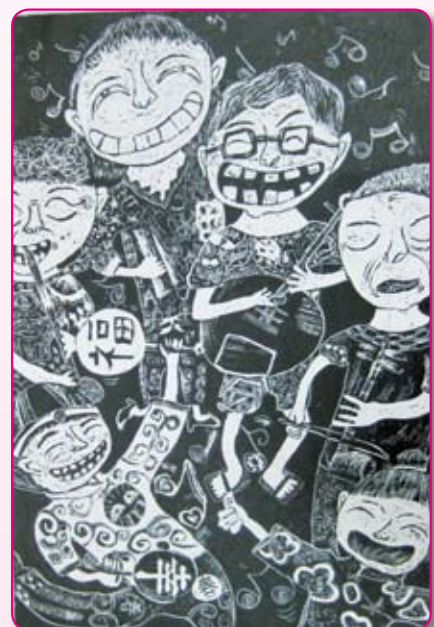
● 絲竹之樂 五信／李孟儒