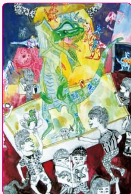
● 恐龍展狂想曲 四孝／邱柏辰