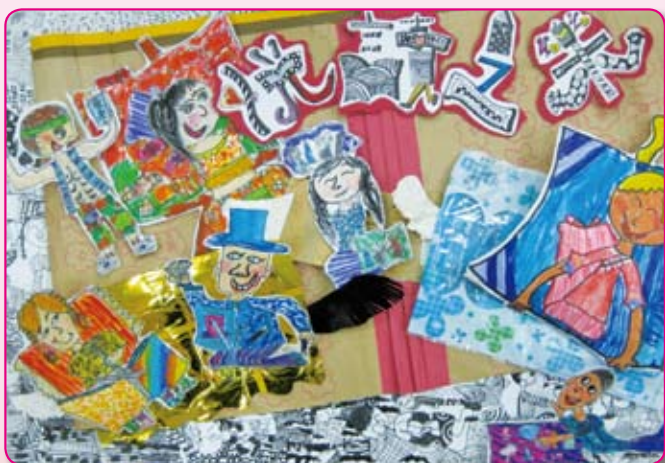
● 悅讀之樂樂無窮 四仁／魏冠鄧