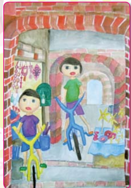
● 騎鐵馬逛老街 三義／羅廣軒