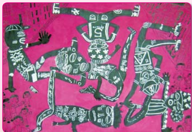
● 街舞 三愛／盧緯瀚